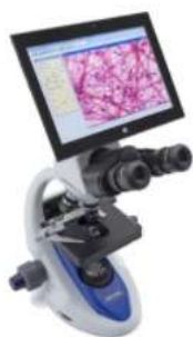
Strumenti per la chimica