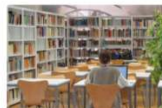
Biblioteche e spazi comuni