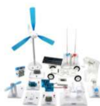
Laboratori per le tecnologie