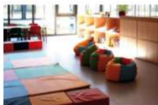
Arredi morbidi per lettura e relax