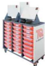
Laboratori per la fisica