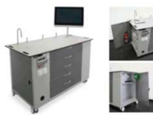
Laboratori scientifici e laboratori scientifici mobili