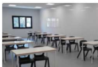
Tavoli per aule e laboratori