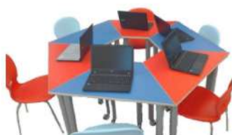
Arredi flessibili e modulari