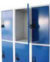
Armadi e lokers studenti