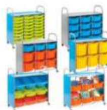
Carrelli e cassettiere