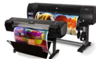
Laboratori d'arte e grafica