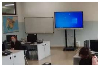
Laboratori informatici e linguistici