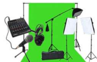
Storetelling, fotografia, podcasting