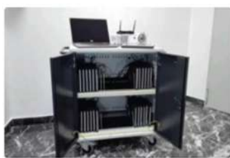
Laboratori multimediali mobili