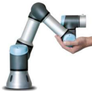
Laboratori per istituti tecnici