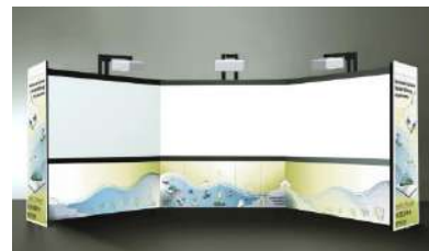
Spazi immersivi ed ambienti pluridisciplinari