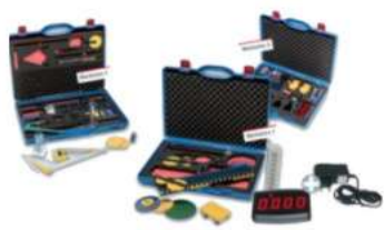
Kit per Materie Tecniche