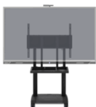
Soluzioni d'arredo per le tecnologie