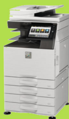
MX-2651 / MX-3051 MX-3551 / MX-4051