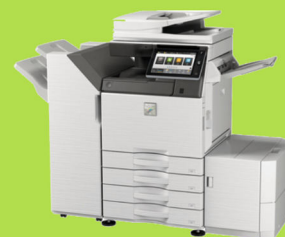
MX-3071 / MX-3571 MX-4071