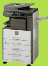
MX-M266N / MX-M316N / MX-M356N