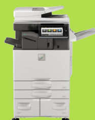
MX-3061 / MX-3561 MX-4061