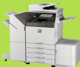
MX-M3050 / MX-M3550 / MX-M4050 / MX-M5050 / MX-M6050