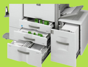
MX-M3070 / MX-M3570 / MX-M4070 / MX-M5070 / MX-M6070