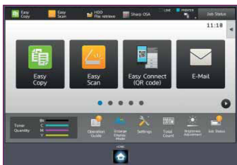
L'icona QR può essere facilmente configurata nella schermata Home.

Per una flessibilità ancora maggiore, la doppia connettività di rete opzionale permette di condividere la stessa MFP su due reti diverse, una delle quali può essere wireless, anche se hanno limitazioni di utilizzo o impostazioni di sicurezza diverse.