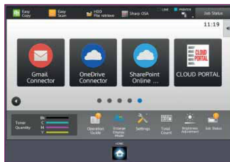
Connessione diretta a servizi di cloud pubblici e Cloud Portal Office.

Diminuisce anche il rischio di dimenticare documenti importanti o sensibili dove chiunque possa vederli. Grazie alla funzione Print Release puoi inviare un lavoro da stampare e, quando sei pronto, avvicinarti alla stampante più comoda, accedere e stampare le informazioni.