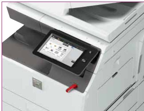
Inserisci la tua USB e inizia a stampare o ad acquisire.

Un'unità hard disk (HDD) integrata da 500 GB consente di archiviare documenti voluminosi e complessi, cui si può accedere rapidamente grazie al sistema di archiviazione documentale. Per la massima praticità, la tecnologia Office Direct Print di Sharp* ti permette di stampare qualsiasi documento senza dover nemmeno usare il PC. Ti basta avvicinarti alla MFP, inserire una chiavetta USB contenente immagini, file Adobe PDF o Microsoft® Office e stampare ciò che desideri. Oppure puoi acquisire e salvare rapidamente i documenti direttamente sulla USB.