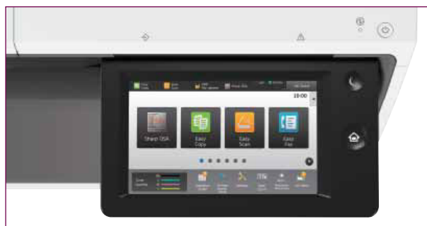
Gli utenti possono personalizzare la schermata home per lavorare in modo più efficiente.

Queste MFP sono dotate di un ampio touchscreen a colori da 7" che può essere orientato per consentire la massima visibilità. Easy Mode garantisce inoltre l'accesso immediato alle funzioni di uso quotidiano, come "Scansione" e "Copia", visualizzandole sotto forma di grandi icone. Oppure, se ci sono altre funzioni utilizzate con maggiore frequenza, puoi semplicemente trascinare le relative icone sulla tua schermata home per velocizzare l'accesso.