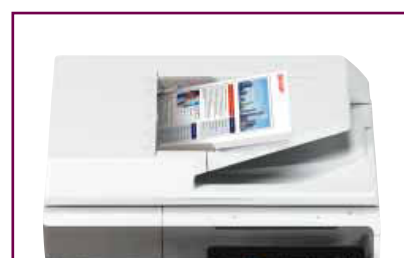
Alimentatore degli originali fronte-retro da 50 fogli.

MX-B455W offre un alimentatore degli originali a singola passata fronte-retro da 100 fogli mentre MX-B335W dispone di un alimentatore degli originali fronte-retro da 50 fogli; entrambi sono perfetti per ambienti come le reception, dove le scansioni devono essere eseguite in modo tempestivo.