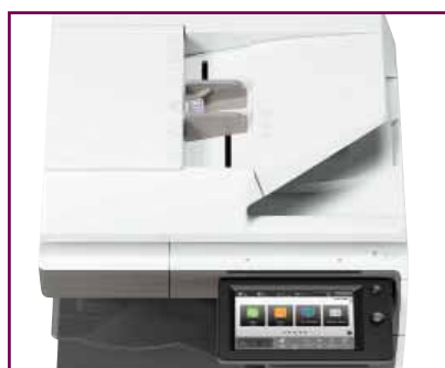
Acquisisci carte d'identità e biglietti da visita

E poiché sappiamo che le tue esigenze di scansione non si limitano ai documenti, puoi acquisire in modo rapido e accurato anche carte d'identità e biglietti da visita.