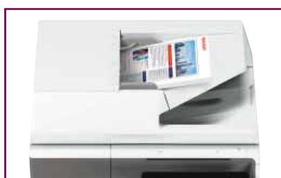
Alimentatore degli originali a singola passata fronte-retro da 100 fogli.

Le MFP MX-B455W/MX-B355W vantano una velocità di scansione in bianco e nero e a colori di 110 ipm per la rapida digitalizzazione dei documenti, consentendoti di controllare il tuo flusso di lavoro documentale.