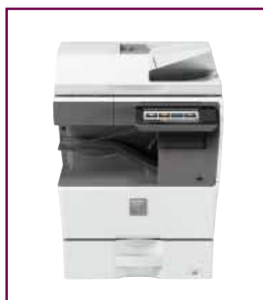
Configurazione compatta desktop

E cosa ne pensi di consentire ai visitatori di utilizzare il dispositivo, anche se non sono connessi alla rete aziendale? Abbiamo pensato anche a questo. È possibile stampare i documenti Microsoft Office direttamente dalle chiavette USB, in modo facile e veloce.