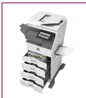
Capacità carta ampliabile.