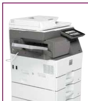
Finisher interno opzionale