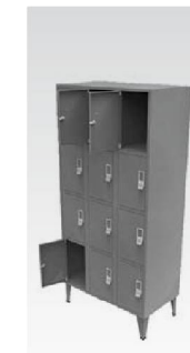
Ld 04 P