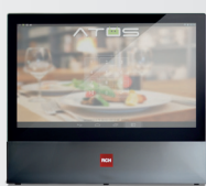
Alto 285 mm

La peculiarità di Atos 15 GD (ATOS Graphic Display), è il display grafico 7" in risoluzione 1024x600 lato utente che permette la visualizzazione della preview dello scontrino e la visualizzazione di video pubblicitari sempre in versione Multilingua.